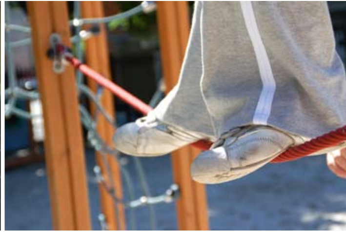
Les deux pieds sur terre, ou en l'air : exercices en plaine de jeux, en mai 2009.

« Je pense qu'il est impossible de respecter les autres, et de se respecter soi-même, si l'on ne peut partager des émotions communes. Il est donc impératif de pouvoir être participatif et non uniquement 'consommateur' d'une culture qui nous est si facilement imposée. »