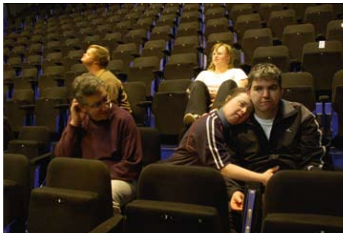
Fausse détente, vrai stress ?

Pas du tout : l'équipe est sereine en arrivant au Varia.